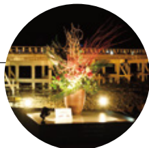
「いけばな プロムナード」